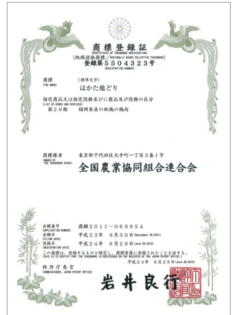
■ 地域団体商標制度

このような地域名と商品名からなる商標がより早い段階で商標登録を受けられるようにすることにより、地域ブランドの育成に資するため、平成17年の通常国会で「商標法の一部を改正する法律」が成立しました。平成18年4月1日に同法が施行され、地域団体商標制度がスタートし、高い関心を集めています。「はかた地どり」は平成24年度に登録されました。