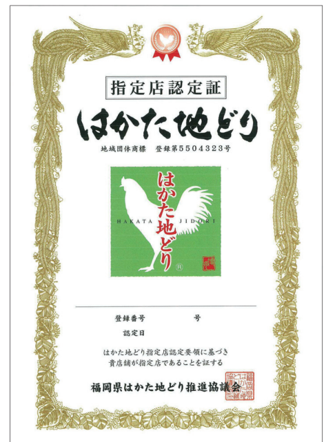
■ はかた地どり指定店認定証