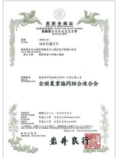
■地域団体商標制度

このような地域名と商品名からなる商標がより早い段階で商標登録を受けられるようにすることにより、地域ブランドの育成に資するため、平成17年の通常国会で「商標法の一部を改正する法律」が成立しました。平成18年4月1日に同法が施行され、地域団体商標制度がスタートし、高い関心を集めています。「はかた地どり」は平成24年度に登録されました。