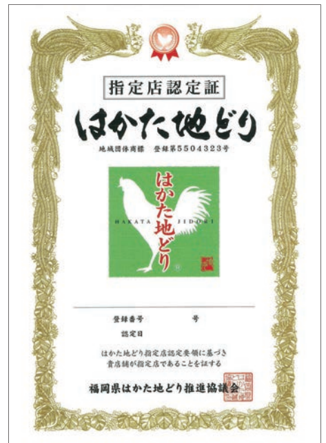
■はかた地どり指定店認定証